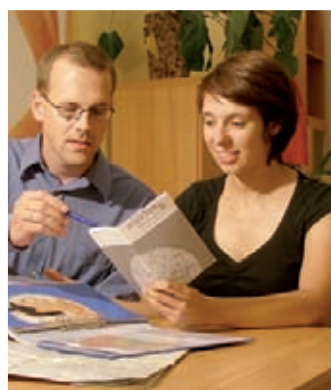
Von links nach rechts: Radbeschilderung München, Mobilitätsberatung für Schüler, Neubürgermarketing.

Im Rahmen des Wettbewerbs „Best Practice im Mobilitätsmanagement“ prämiieren die dena und das Bundesministerium für Umwelt, Naturschutz und Reaktorsicherheit (BMU) erfolgreiche Mobilitätsmanagement-Projekte aus ganz Deutschland. Die ausgezeichneten Betriebe und Kommunen motivieren ihre Beschäftigten und Bürger mit innovativen und effektiven Maßnahmen zum Umstieg vom Pkw auf effizientere Verkehrsmittel wie den öffentlichen Nahverkehr oder das Fahrrad und zur Bildung von Fahrgemeinschaften. Die Maßnahmen fördern eine Reduzierung des Pkw-Verkehrs und regen zur Nachahmung an.