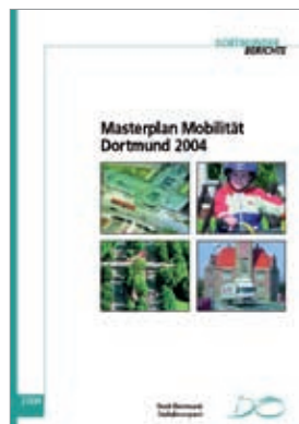
Von links nach rechts: Teilnahme an der Aktion „Mit dem Rad zur Arbeit“, Mobilitätsberatung an Grundschulen, Masterplan Mobilität Dortmund.

Im Rahmen des Wettbewerbs „Best Practice im Mobilitätsmanagement“ prämiieren die dena und das Bundesministerium für Umwelt, Naturschutz und Reaktorsicherheit (BMU) erfolgreiche Mobilitätsmanagement-Projekte aus ganz Deutschland. Die ausgezeichneten Betriebe und Kommunen motivieren ihre Beschäftigten und Bürger mit innovativen und effektiven Maßnahmen zum Umstieg vom Pkw auf effizientere Verkehrsmittel wie den öffentlichen Nahverkehr oder das Fahrrad und zur Bildung von Fahrgemeinschaften. Die Maßnahmen fördern eine Reduzierung des Pkw-Verkehrs und regen zur Nachahmung an.