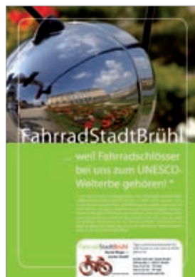
Von links nach rechts: Einführung einer Stadtbuslinie, erfolgreiches Fahrradmarketing, „FahrradStadtBrühl“-Kampagnenplakat.

Im Rahmen des Wettbewerbs „Best Practice im Mobilitätsmanagement“ prämiieren die dena und das Bundesministerium für Umwelt, Naturschutz und Reaktorsicherheit (BMU) erfolgreiche Mobilitätsmanagement-Projekte aus ganz Deutschland. Die ausgezeichneten Betriebe und Kommunen motivieren ihre Beschäftigten und Bürger mit innovativen und effektiven Maßnahmen zum Umstieg vom Pkw auf effizientere Verkehrsmittel wie den öffentlichen Nahverkehr oder das Fahrrad und zur Bildung von Fahrgemeinschaften. Die Maßnahmen fördern eine Reduzierung des Pkw-Verkehrs und regen zur Nachahmung an.