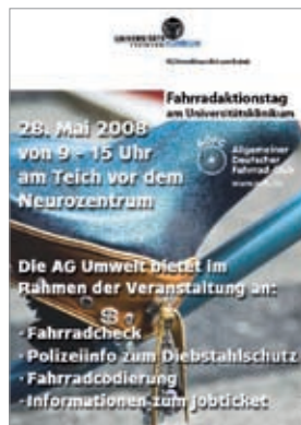
Von links nach rechts: Fahrradabstellplatz auf dem Klinikumgelände, neu eingerichteter Bahnhaltepunkt, Plakat Fahrradaktionstag.

Im Rahmen des Wettbewerbs „Best Practice im Mobilitätsmanagement“ prämiert die dena und das Bundesministerium für Umwelt, Naturschutz und Reaktorsicherheit (BMU) erfolgreiche Mobilitätsmanagement-Projekte aus ganz Deutschland. Die ausgezeichneten Betriebe und Kommunen motivieren ihre Beschäftigten und Bürger mit innovativen und effektiven Maßnahmen zum Umstieg vom Pkw auf effizientere Verkehrsmittel wie den öffentlichen Nahverkehr oder das Fahrrad und zur Bildung von Fahrgemeinschaften. Die Maßnahmen fördern eine Reduzierung des Pkw-Verkehrs und regen zur Nachahmung an.